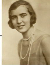
Ingrid von Schweden †