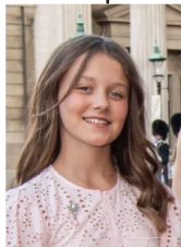
Prinzessin Isabella zu Dänemark