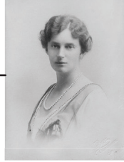
Herzogin Alexandrine von Mecklenburg-Schwerin †