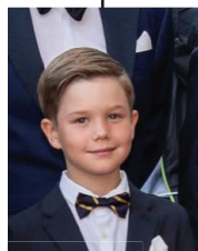
Prinz Vincent von Dänemark