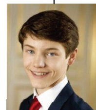
Prinz Felix zu Dänemark