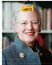
Königin Margrethe II