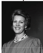
Anne-Marie von Griechenland