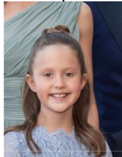
Prinzessin Josephine von Dänemark