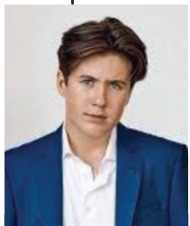
Prinz Christian zu Dänemark