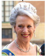
Benedikte Prinzessin zu Sayn-Wittgenstein-Berleburg