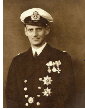
König Frederik von Dänemark †