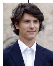
Prinz Nikolai von Dänemark