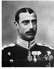
König Christian X †