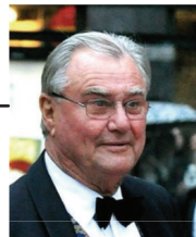
Graf Henri de Laborde de Monpezat †