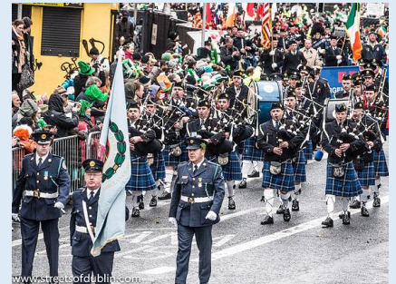
St. Patrick's Day